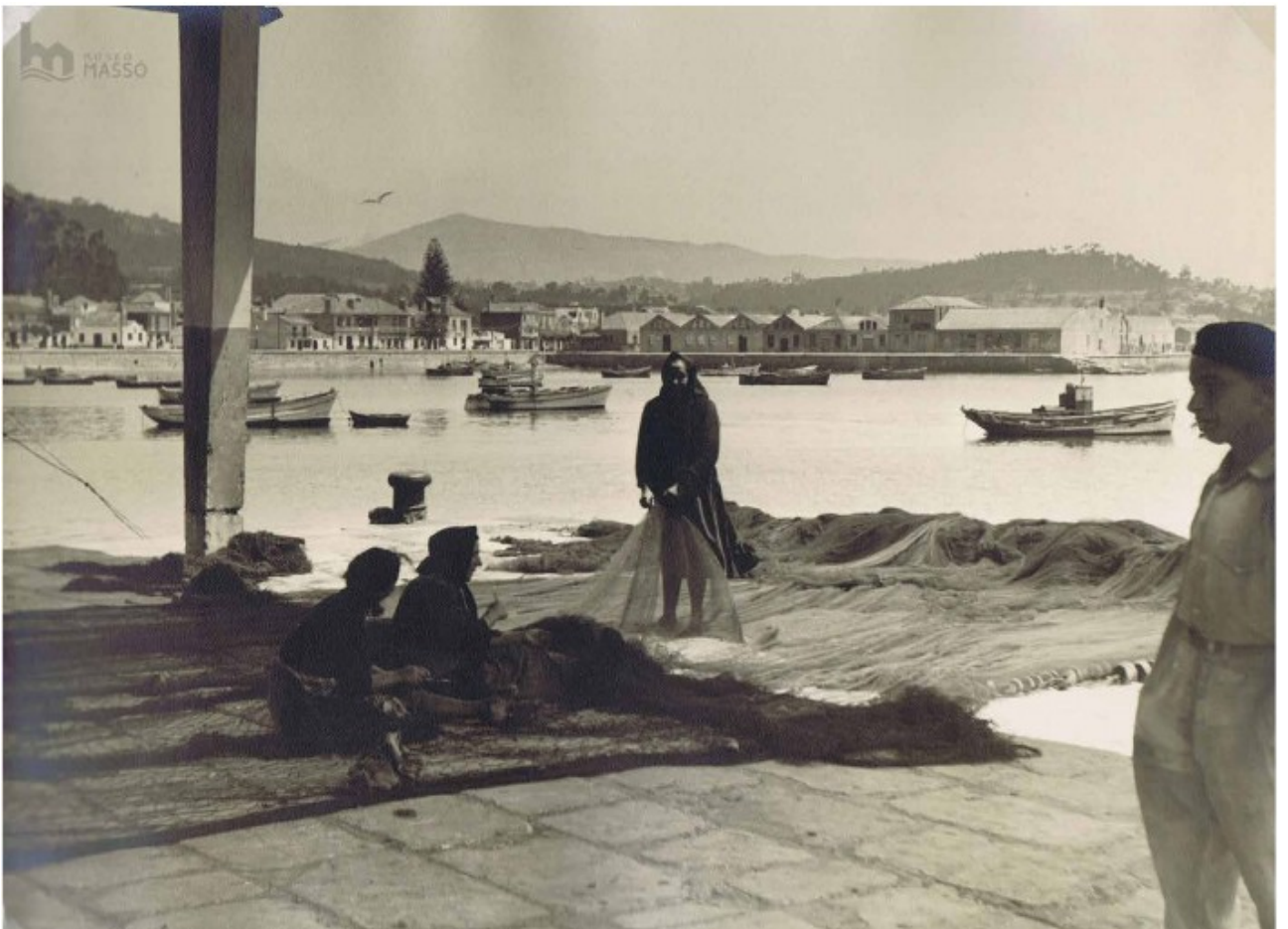
Redeiras no peirao de Cangas. Cangas (Pontevedra), cara a 1920