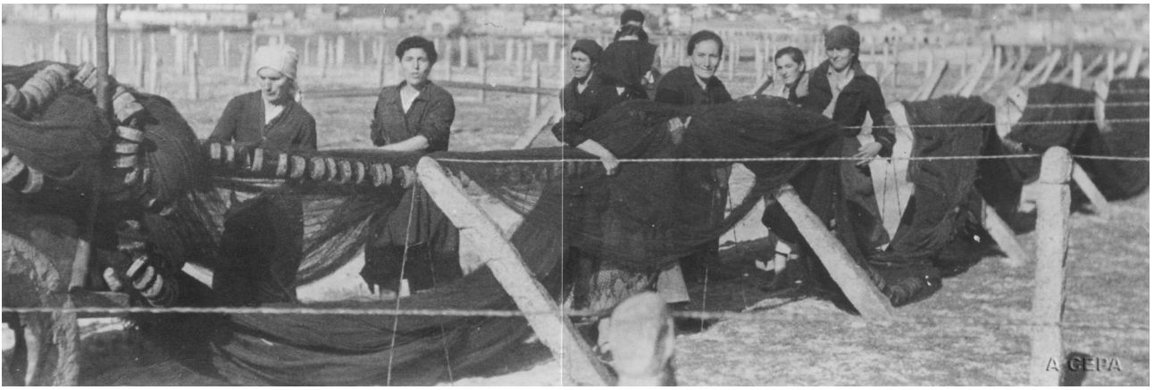
Redeiras estirando aparello de cerco no tendal de Rodeira. Cangas (Pontevedra), 1947