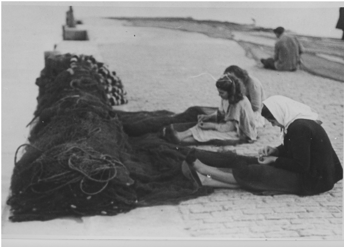
Redeiras no peirao de Cangas. Cangas (Pontevedra), anos 50