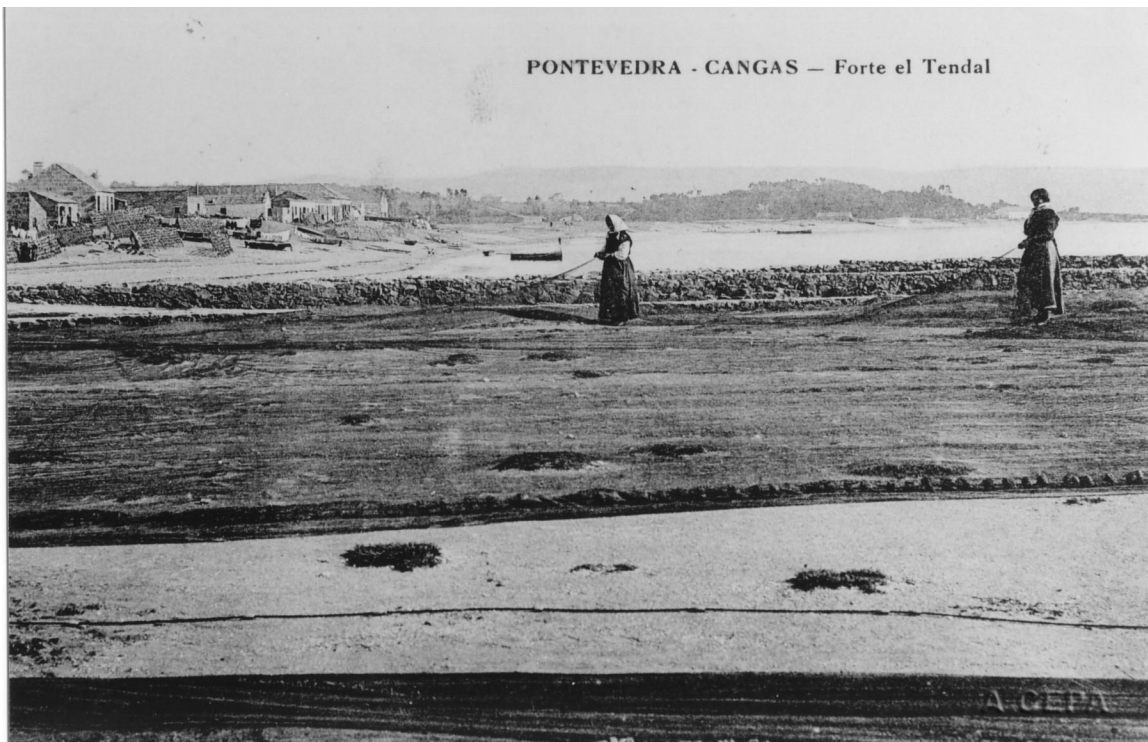
Redeiras no tendal do Forte. Cangas (Pontevedra), 1920