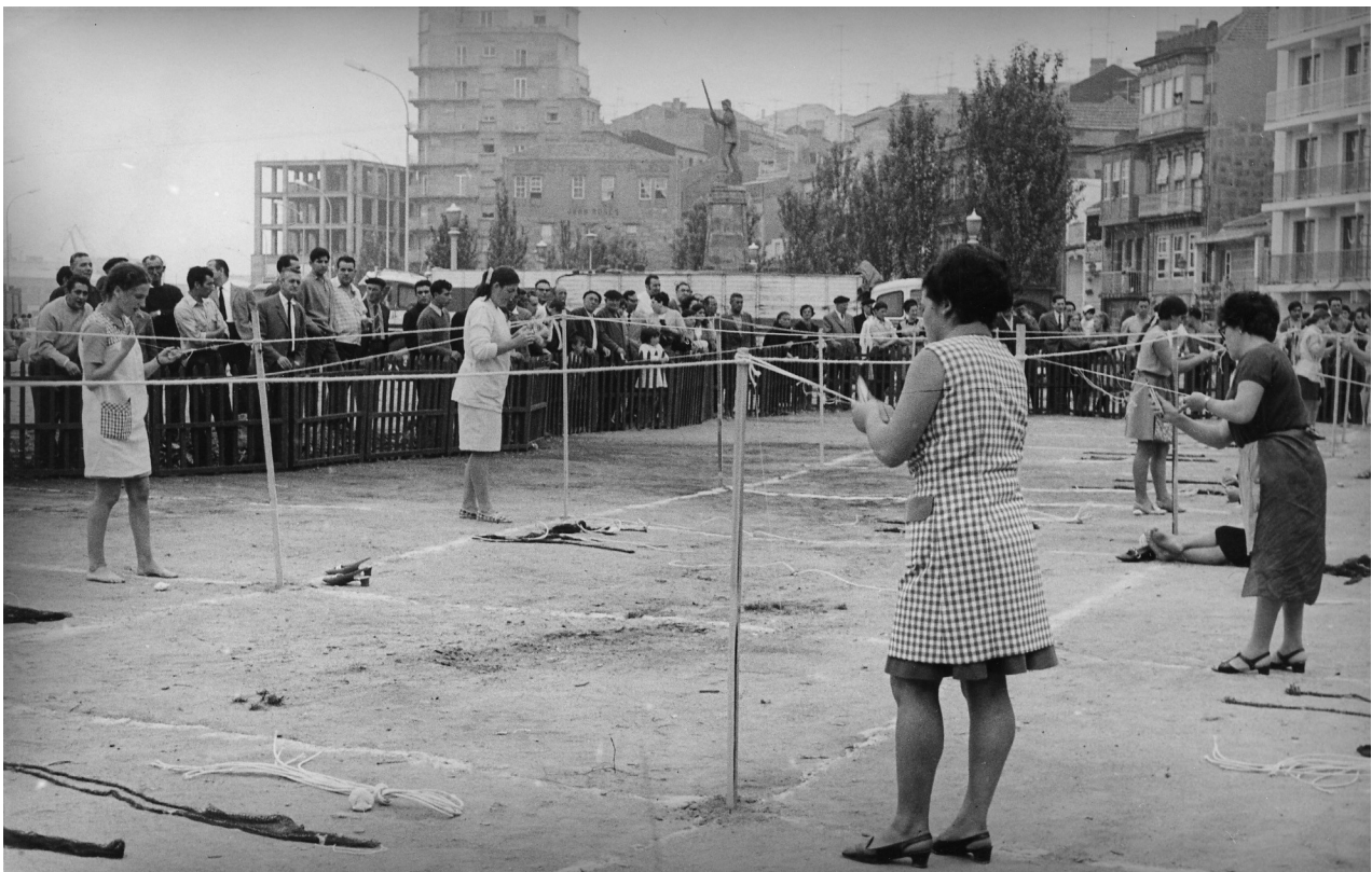
Redeiras de Cangas nunha competición no Berbés. Vigo (Pontevedra), anos 70