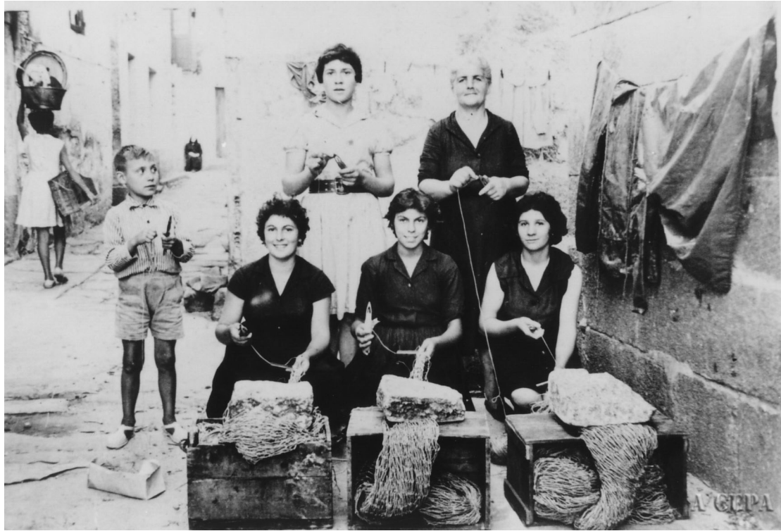
Facendo redes a carón da Capela do Hospital. Cangas (Pontevedra), 1958