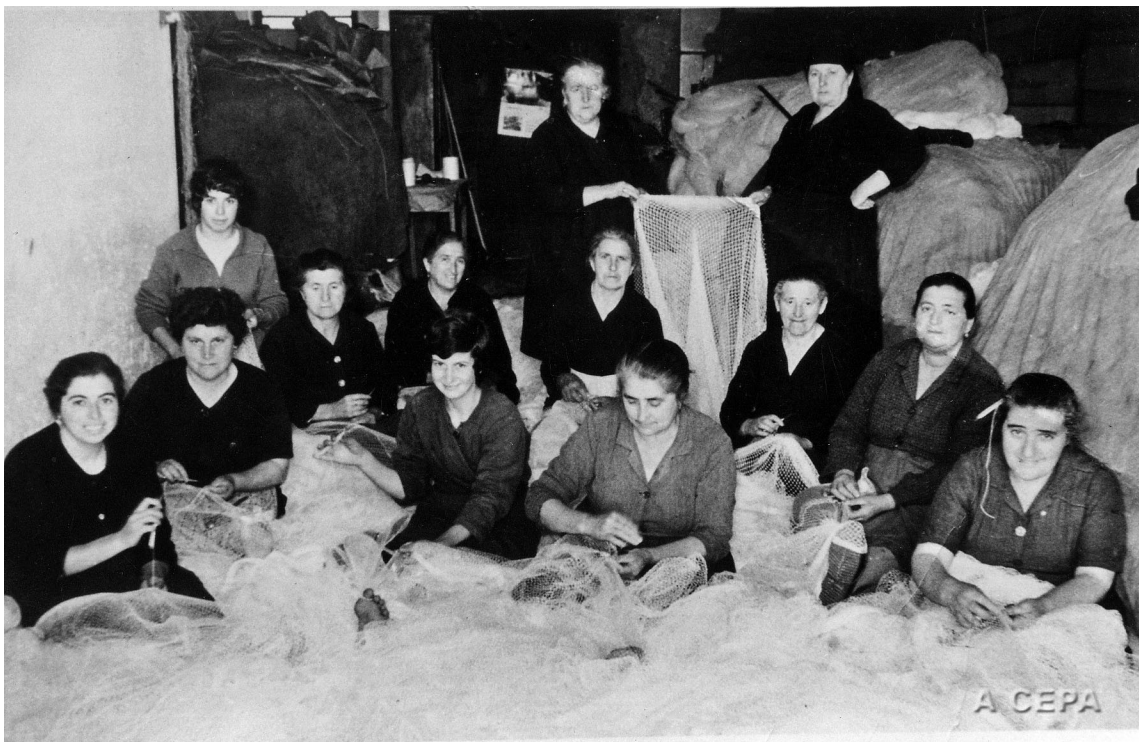
Redeiras na chabola de Chiquitas. Cangas (Pontevedra), 1962