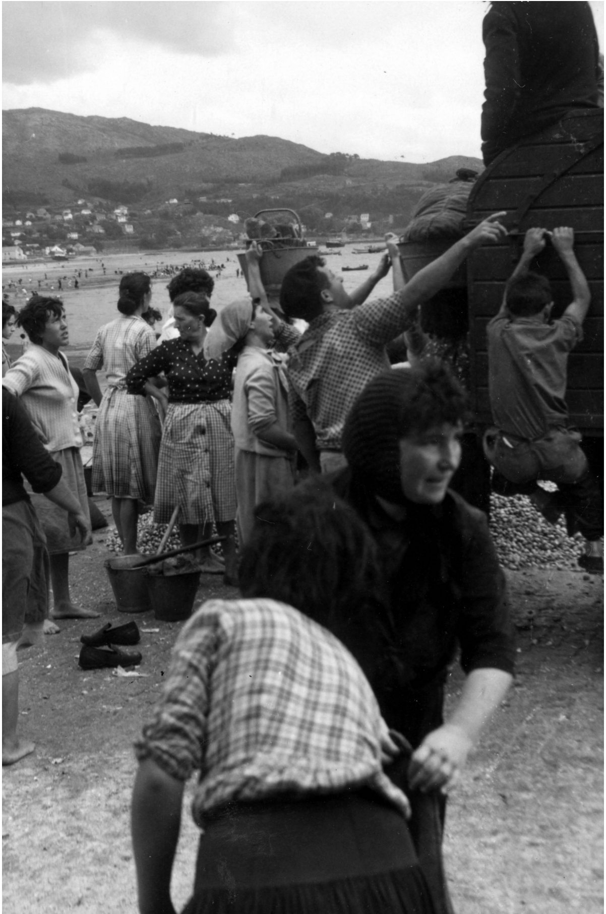
Marisqueo, carga e descarga, s.d.