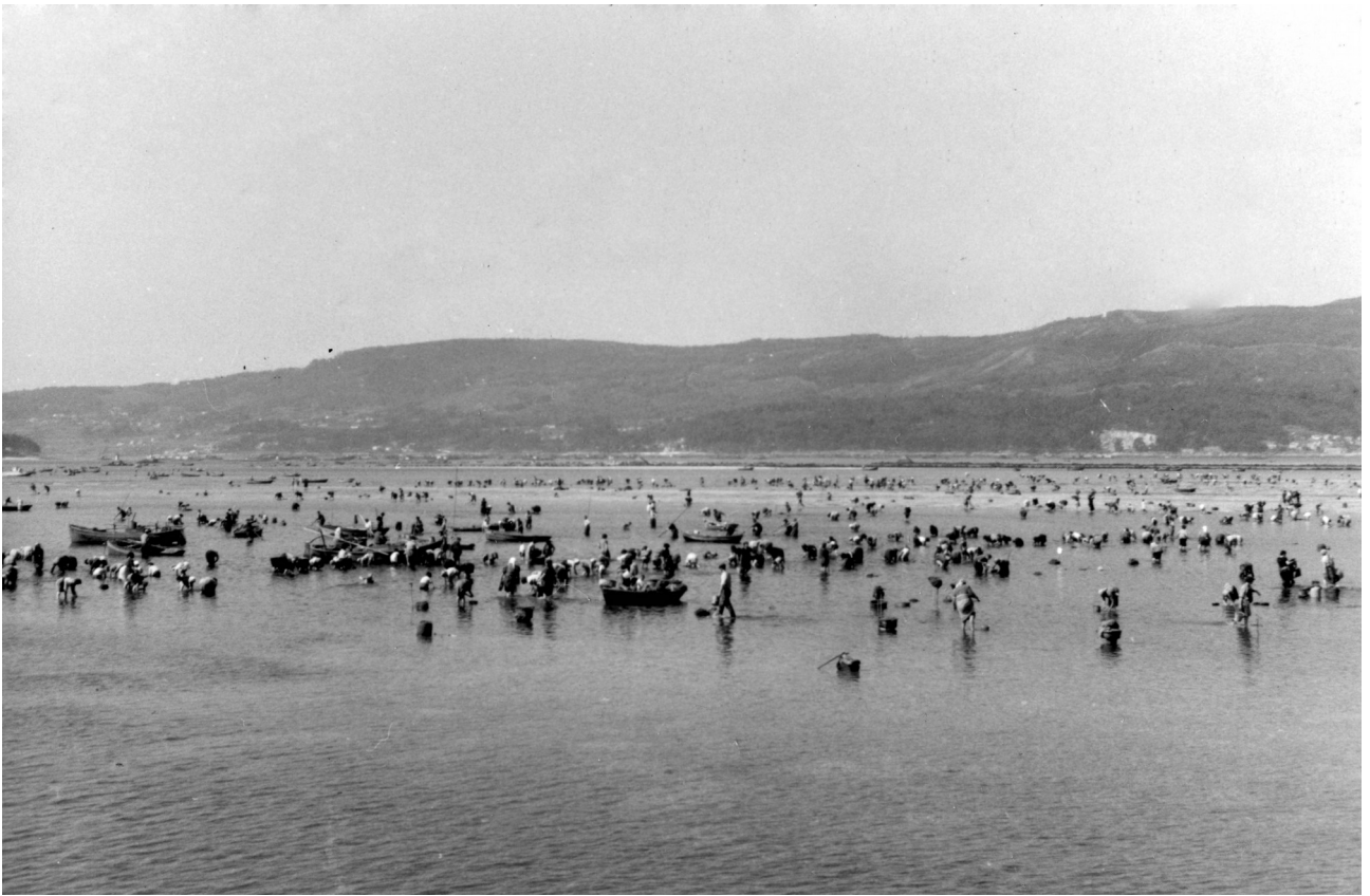
Mariscando en Placeres (Pontevedra), s.d. Archivo Attilio Gaggero-431