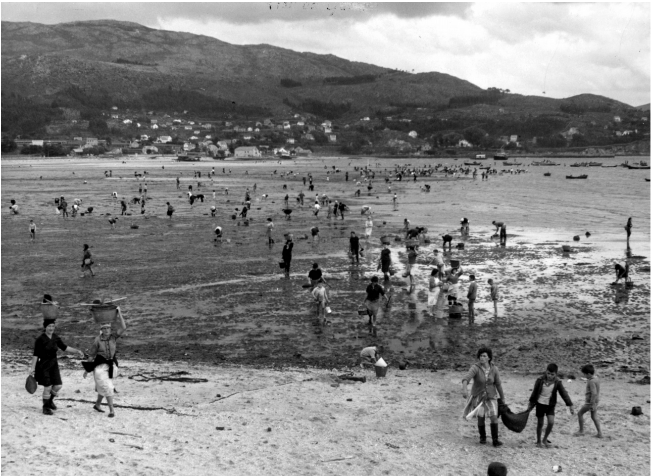
Mariscadoras en Placeres (Pontevedra), s.d. Archivo Attilio Gaggero-141