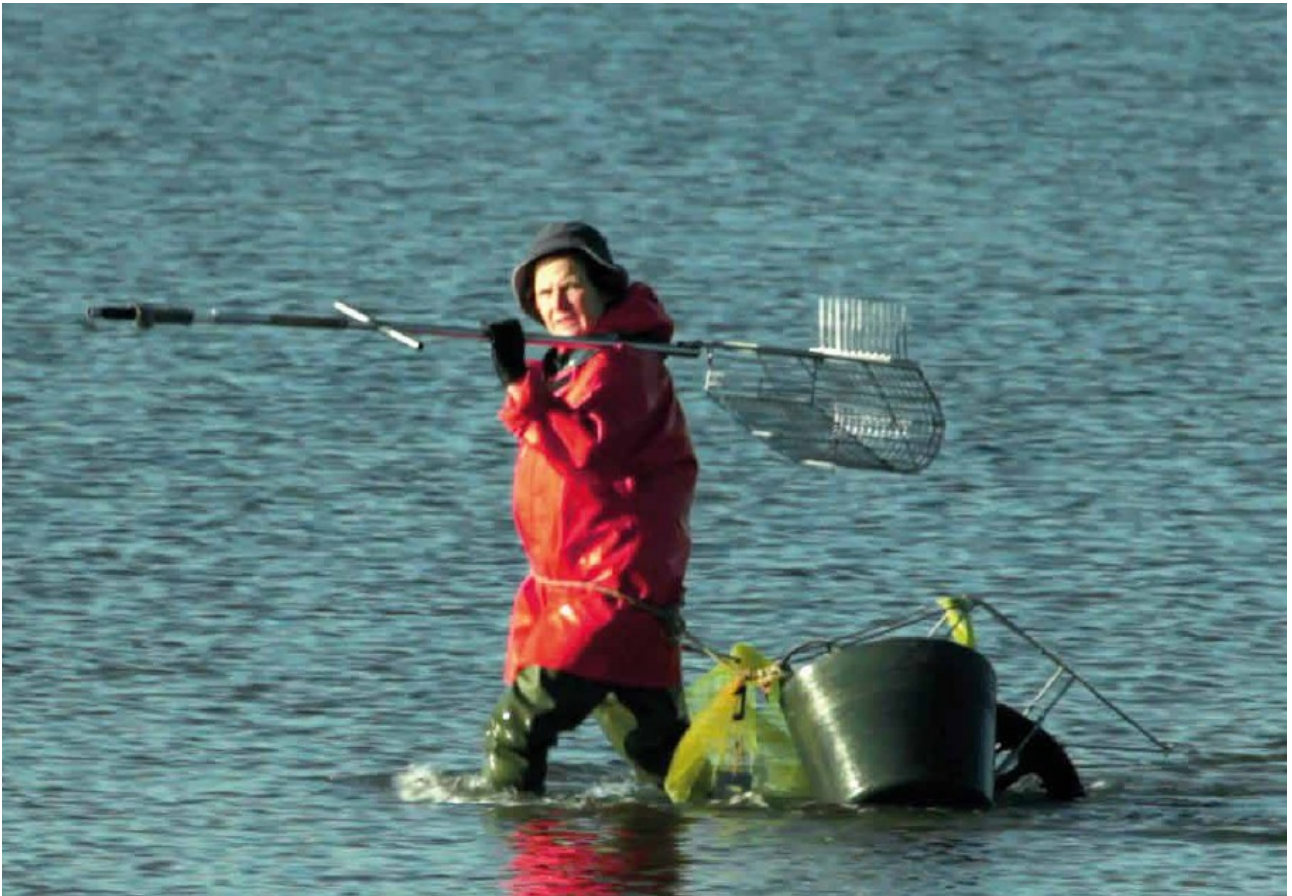
A mariscar. Cambados. (Pontevedra), 2017.