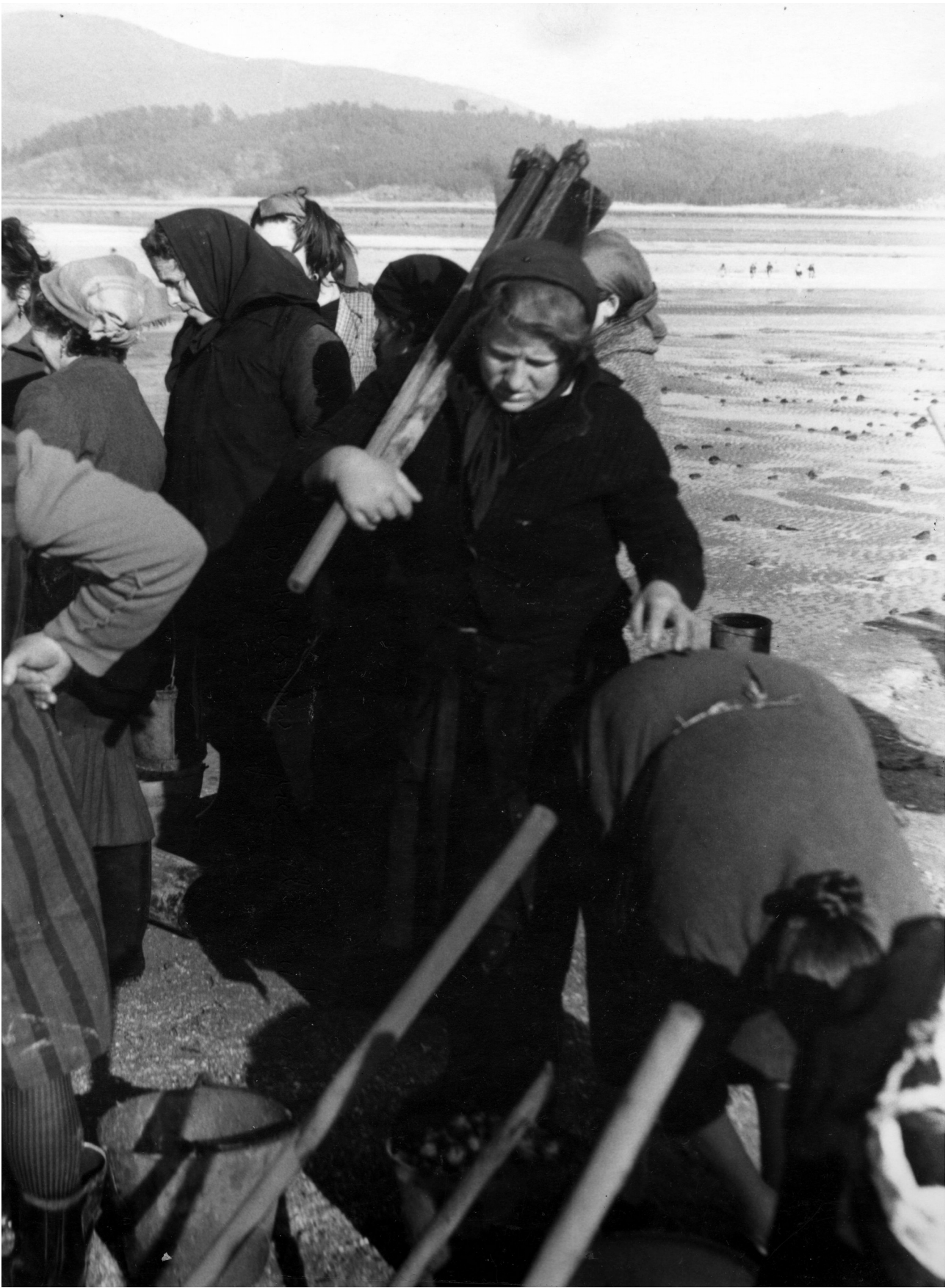
A mariscar cos sachos das leiras. Placeres. (Pontevedra), contra 1960.