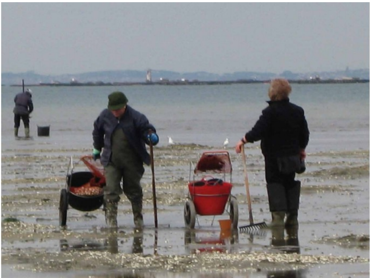
Carriños innovadores das mariscadoras. Cambados (Pontevedra), 2017