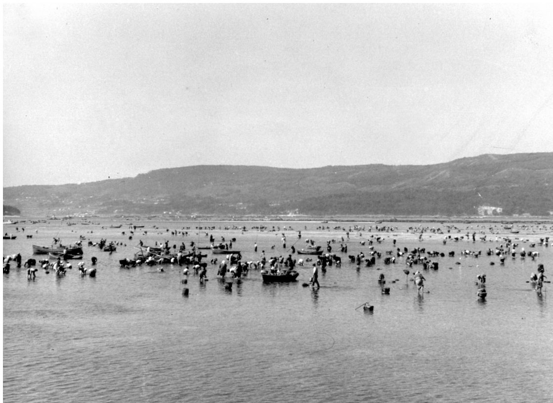
Mariscadoras en Placeres (Pontevedra), s.d.