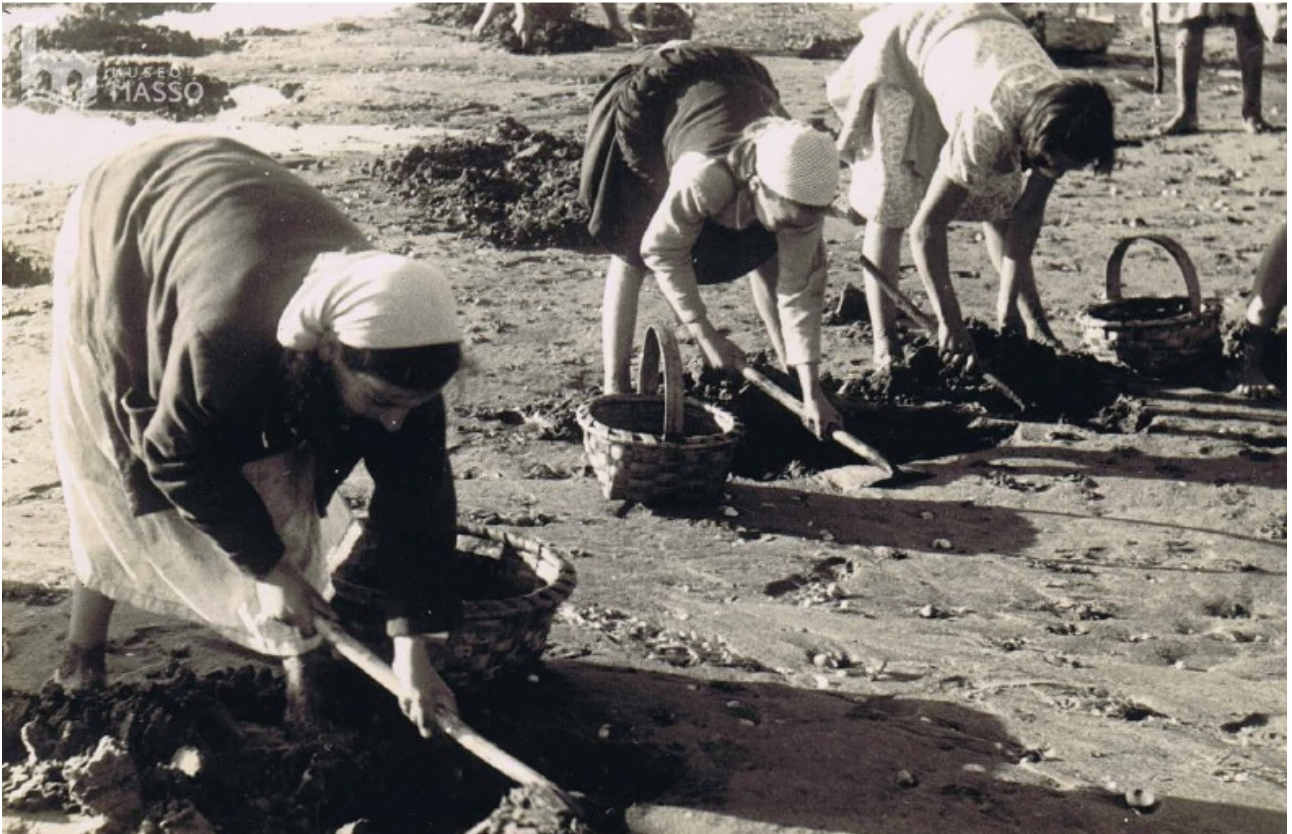
Mariscadoras rastrexando ameixas en Arcade (Pontevedra), cara a 1960