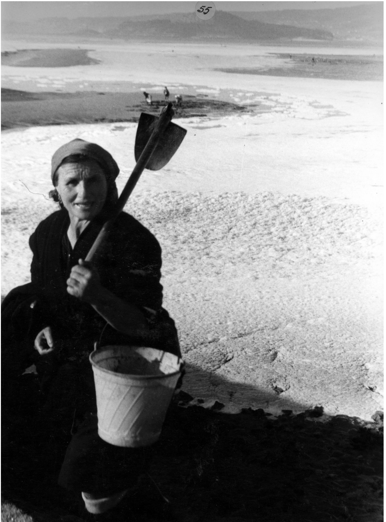
A mariscar cos sachos das leiras. Placeres. (Pontevedra), contra 1960.