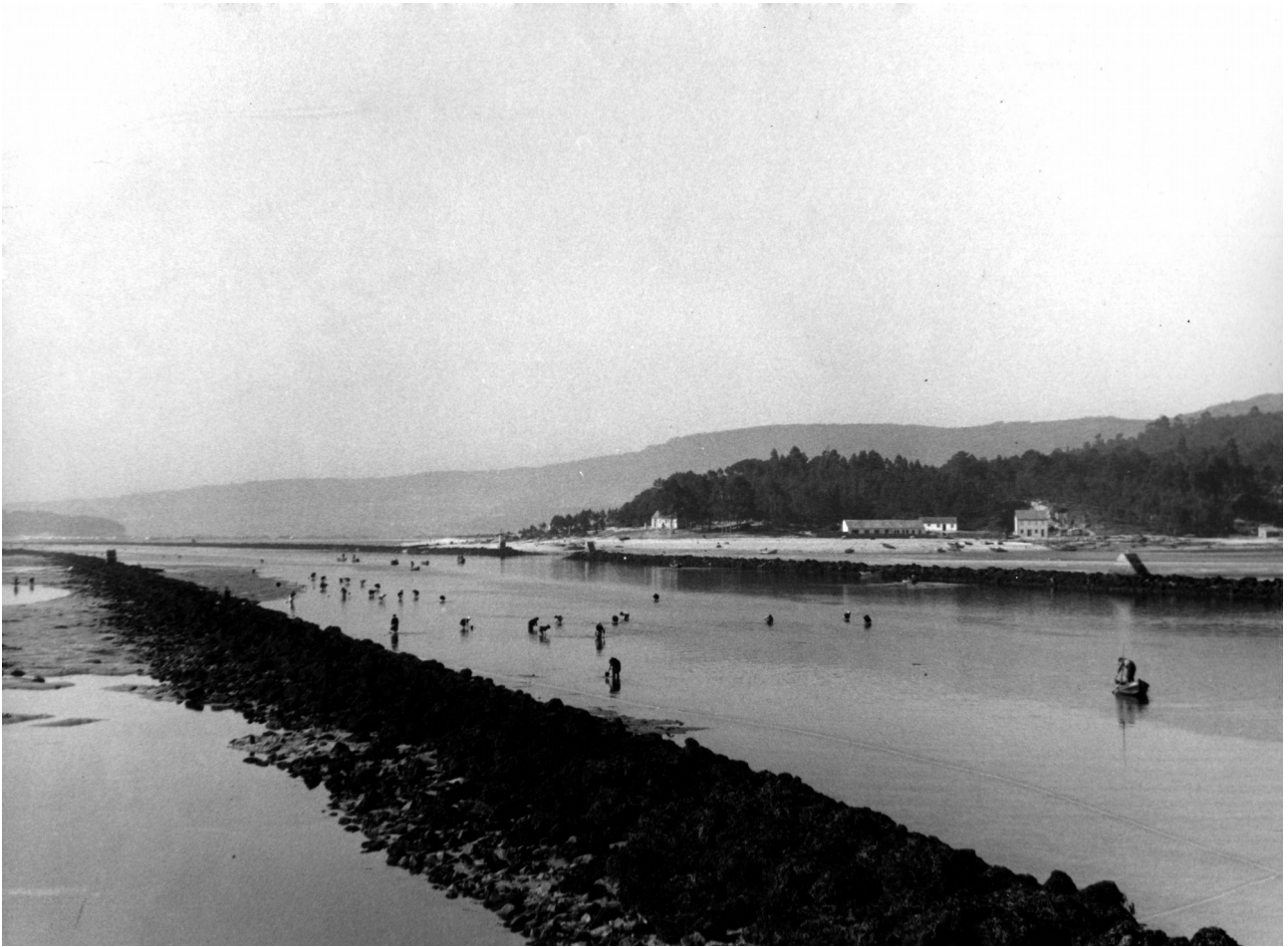
Mariscando en Placeres (Pontevedra), s.d.