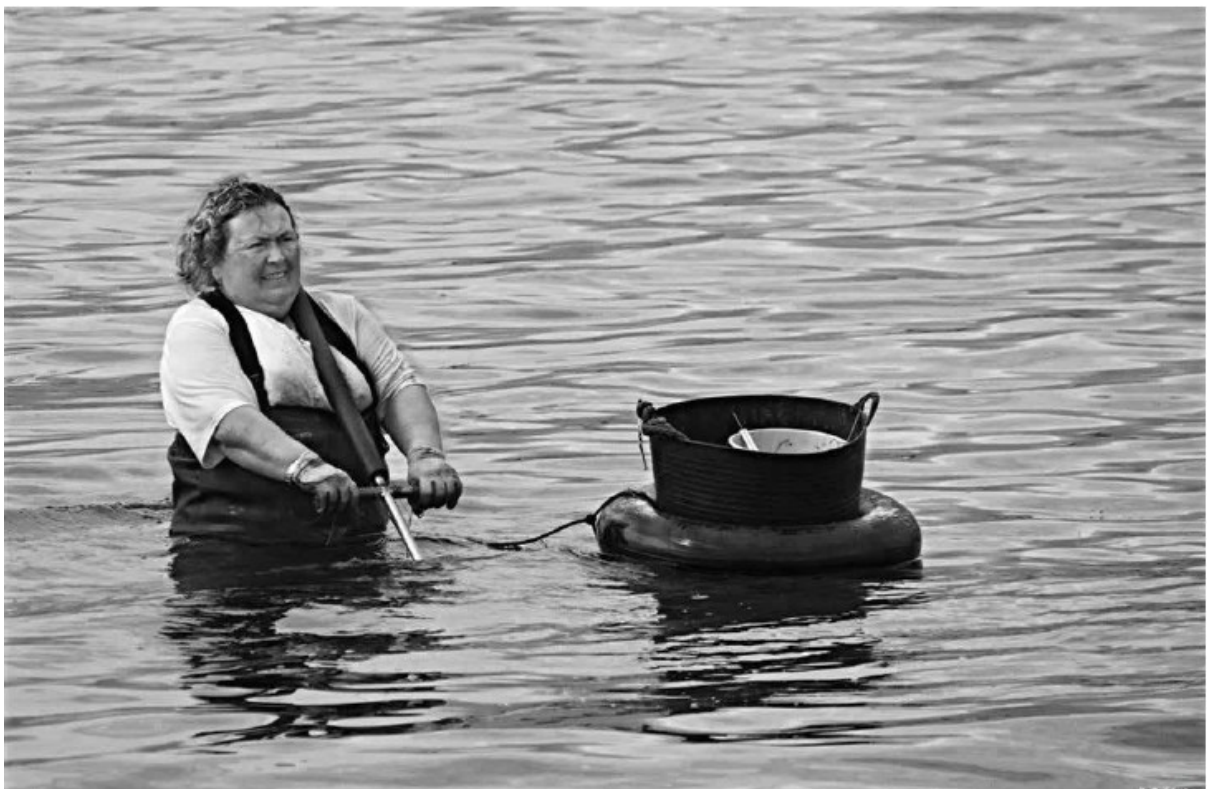
Campana de marisqueo, 1983