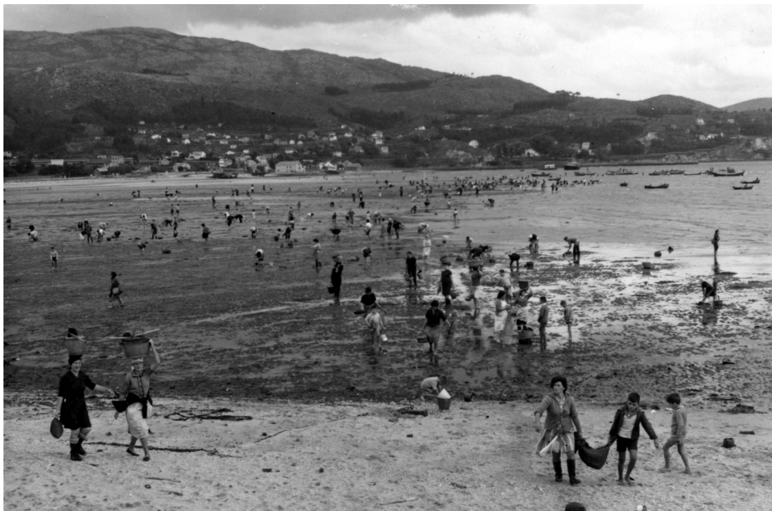
Mariscando en Placeres (Pontevedra), s.d.