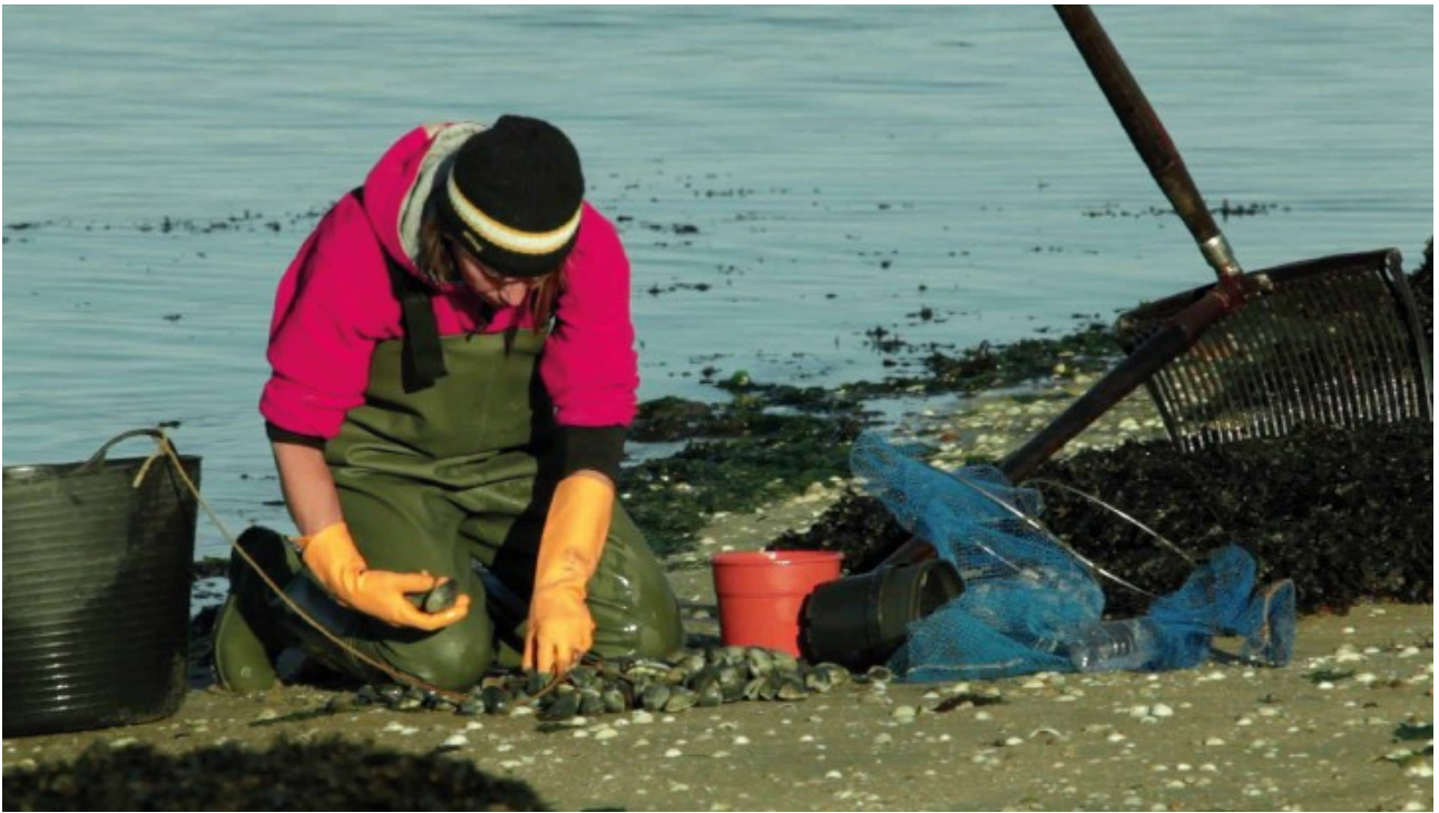
A mariscar. Cambados (Pontevedra), 2017 .