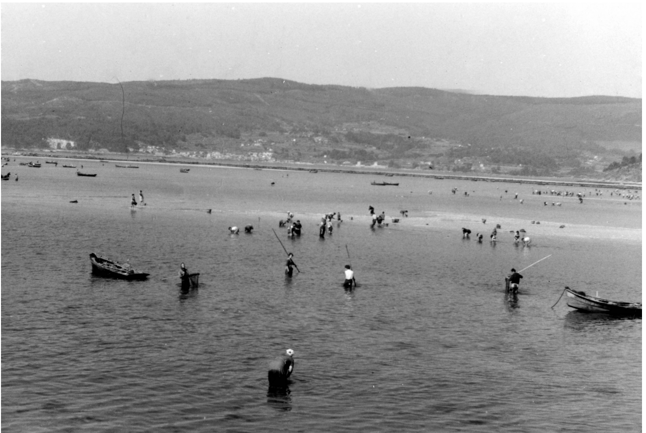
Mariscando en Placeres (Pontevedra), s.d.