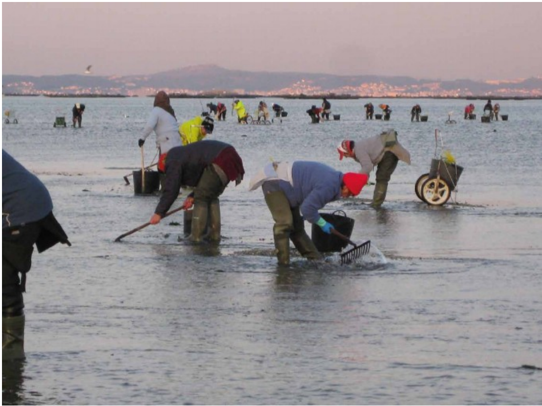
Mariscadoras. Cambados (Pontevedra), 2017